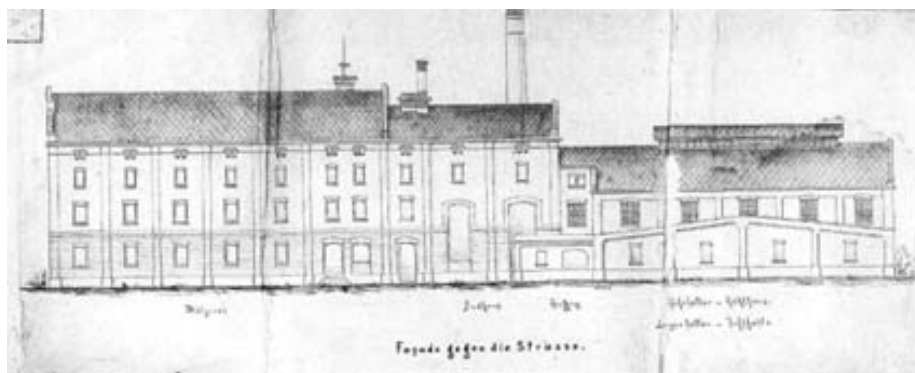
Ryc. 3. Projekt budynku produkcyjnego browaru, elewacja frontalna, 1872 r. (archwium).

Najistotniejsze funkcje w kompleksie zabudowań produkcyjnych spełniał budynek, w którym znajdowały się pomieszczenia słodowni, suszarni, kotłowni i warzelnii, położony we wschodniej części założenia. Od strony południowej z budynkiem sąsiadują pomieszczenia magazynowe. Projekt budynków browaru został zatwierdzony 19 marca 1872 roku, a wykonał go nowosolski budowniczy F. Jäkel 13 , który we współpracy z zakładami Augusta Heidera 14 przeprowadził do 1873 roku również prace budowlane.