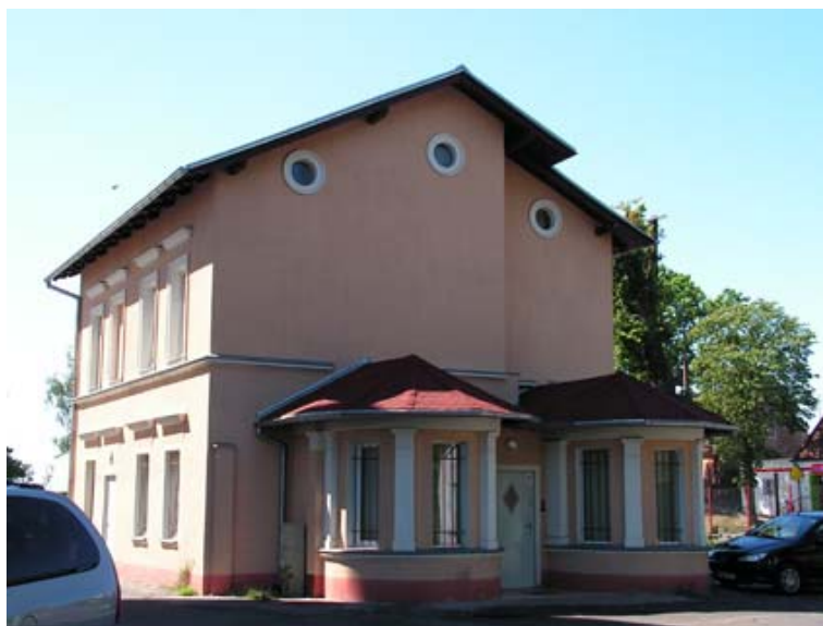
Ryc. 6. Budynek dawnej portierni w widoku od północnego-zachodu. Stan obecny.

Kilka lat temu obiekt został poddany gruntownemu remontowi. Odstępstwem od pierwotnego zarysu bryły jest dobudowany drugi półkolisty wykusz na północno-zachodnim narożniku.