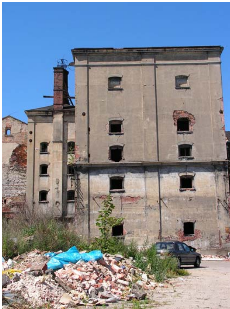
Ryc. 4. Elewacja wschodnia, pomieszczenia suszarni. Stan obecny.

pierwszego piętra słodowni 17 . W nowo wybudowanej części, nieco szerszej od pozostałych, umieszczono bramę przelotową. Prostokątnie zamknięty przejazd sięgał niewiele ponad gzyms między parterem a piętrem.