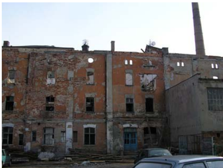
Ryc. 5. Elewacja frontalna zachodnia budynku słodowni. Stan obecny.

kątnych otworach, zamkniętych łukiem odcinkowym. Dodatkowo okna na parterze miały szerokie, proste opaski, natomiast na piętrze mieściły się okna w większym rozmiarze i zaopatrzone w drewniane okiennice. Budynek o rozbudowanym gzymsie koronującym posiadał spadzisty dach pokryty papą. Fasadę fermentowni i chłodni na wysokości parteru przysłaniają pomieszczenia leżakowni. Zabudowania te, o rzucie prostokąta, przylegają do wyżej omawianego obiektu krótszą, wschodnią ścianą. Ten jednokondygnacyjny obiekt, przykryty dachem spadzistym, posiada analogiczne do budynku fermentowni i chłodni opracowanie elewacji. Zasadniczym akcentem elewacji jest więc układ lizen i pasu pod gzymsem. Według projektów elewacja zachodnia posiadała sześć osi 18 . Okna, tak jak w wyżej opisanych budynkach, miały kształt zbliżony do prostokąta i zamknięte były łukiem odcinkowym. W trzeciej części, od północy, funkcjonowały dwuskrzydłowe drzwi, założone w 1883 roku. Elewacja północna dzieliła się na cztery części o podwójnych oknach, natomiast elewacja południowa była pozbawiona otworów okiennych. Od strony północnej istniała wiata o drewnianych słupach. W pierwotnych planach elewacja zachodnia leżakowni miała być jedynie czteroczęściowa, nie uwzględniono także po tej stronie otworu drzwiowego. W latach dwudziestych XX wieku rozbudowano pomieszczenia