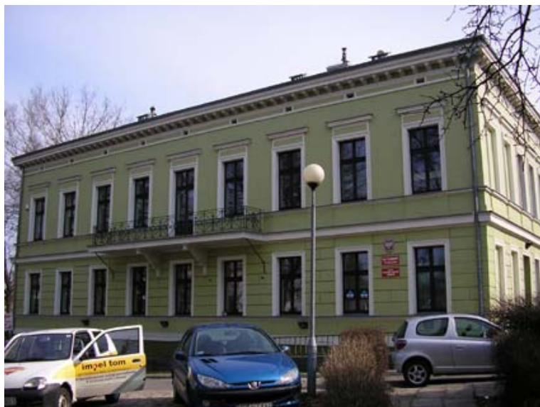
Ryc. 2. Elewacja zachodnia dawnego domu i biura właściciela browaru. Stan obecny.

kół, gzyms oddzielający partie cokołu od boniowanego parteru oraz pas między kondygnacjami, stanowią najwyraźniejsze podziały poziome. Węższe, profilowane pasy znajdują się w strefach podokiennych, nad płycinami. Najbardziej okazały i rozbudowany jest gzyms wieńczący, podtrzymywany przez rząd ozdobnych konsol w kształcie liścia akantu. Pod nim rozciąga się wąski pas z dziewięcioma małymi prostokątnymi otworami, z których każdy umieszczony jest nad poszczególnym oknem, w połowie szerokości. Dodatkowy akcent horyzontalny stanowi balkon umieszczony na piętrze, pod czwartym, piątym i szóstym oknem. Balkon posiada ozdobną metalową balustradę o dekoracji z motywem lilijek i oparty jest na dwóch dużych konsolach. Na bogate zdobienia wsporników w kształcie wolut składają się ornament perełkowy oraz wić roślinna.