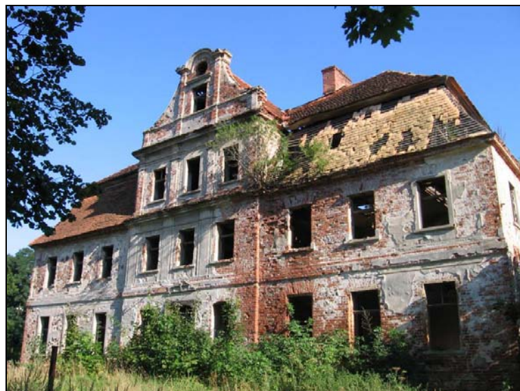
Ryc. 5. Dwór w Studzieńcu.

Dwór obronny w Studzieńcu (Ryc. 5) wzniesiony został w drugiej połowie XVI wieku. Budynek otoczony był nawodnioną fosą, usytuowany na niewielkim wzniesieniu, zwrócony fasadą w kierunku północnym. Była to budowla piętrowa, podpiwniczona, założona na rzucie prostokąta, dwutraktowa z dużą przelotową sienią pośrodku. Ściany były murowane z kamienia i cegły, nad piwnicą sklepienia ceglane, nad parterem i piętrem – stropy drewniane. Po gruntownej przebudowie w XVIII 16 , a potem w XIX wieku, zatarty został jego obronny charakter, a podkreślona funkcja reprezentacyjna. Dwór w wyniku przekształceń otrzymał wygląd barokowy i neoklasycystyczny.