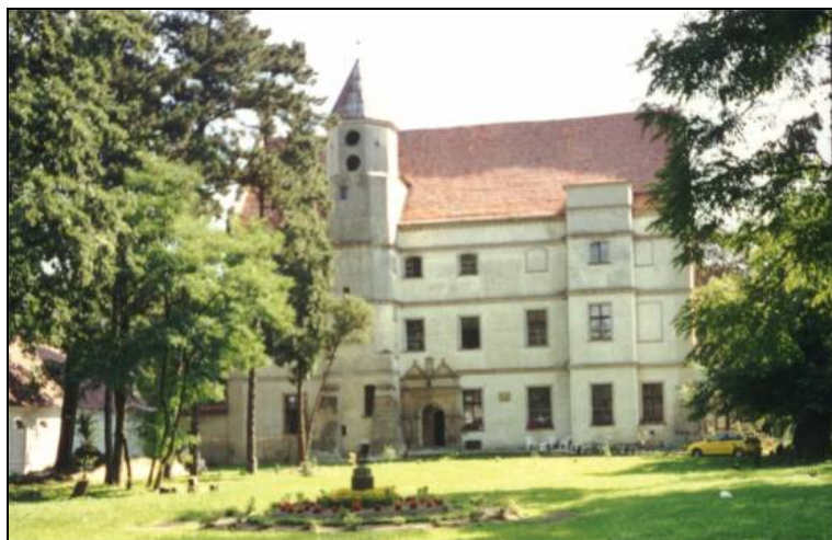
Ryc. 4. Dwór w Czernej.

Renesansowa budowla w Wilkowie pochodzi z połowy XVI wieku. Obiekt usytuowany w bliskim sąsiedztwie jeziora, murowany z cegły, założony był na rzucie prostokąta. Wejście od strony północnej zdołało, zachowane do dzisiaj, renesansowy portal z pilastrami zwieńczonymi trójkątnym frontonem. Podczas odbudowy po pożarze w XVIII wieku 14 dwór został powiększony od strony południowej.