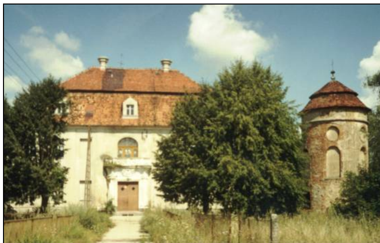
Ryc. 2. Dwór w Chotkowie.

Dwór w Chotkowie (Ryc. 2), usytuowany pośrodku czworobocznego wzniesienia, otoczony był murem z czterema bastejami na narożach i fosą. Budynek wzniesiony został w pierwszej połowie XVI wieku z kamienia i cegły. Dwór, zwrócony fasadą na południe, jest trzykondygnacyjny. W wyniku przebudowy w XVIII wieku budynek uzyskał barokowy wystrój elewacji, a basteje zostały podwyższone do formy cylindrycznych wież 9 . Obecnie fosa jest tylko częściowo nawodniona przepływającym strumykiem, a spośród czterech wież zachowały się tylko dwie na narożach od strony południowej.