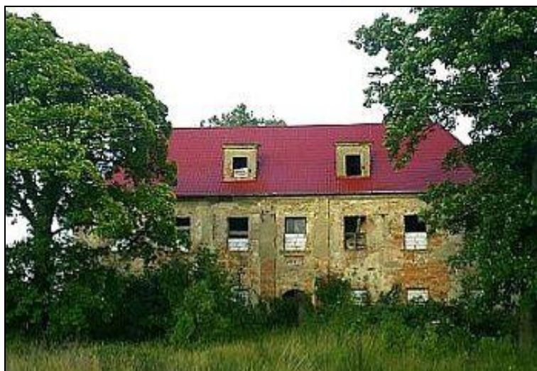
Ryc. 3. Dwór w Borowinie.

Dwór w Borowinie (Ryc. 3) zbudowano w połowie XVI wieku. Budynek zwrócony był fasadą na zachód, murowany z kamienia i cegły, dwukondygnacyjny, założony na rzucie prostokąta. Wejście prowadzi przez kamienny, dwuprzęsłowy most przerzucony przez pierwotnie nawodnioną, a obecnie suchą, fosę otaczającą budynek. Dwór był kilkakrotnie rozbudowywany. Do najstarszych skrzydeł – północnego i zachodniego – w drugiej połowie XVI wieku dobudowano południowe, w XVIII – wschodnie skrzydło 12 . Wszystkie części budynku są tej samej wysokości, skupiają się wokół dziedzińca z krużgankami.