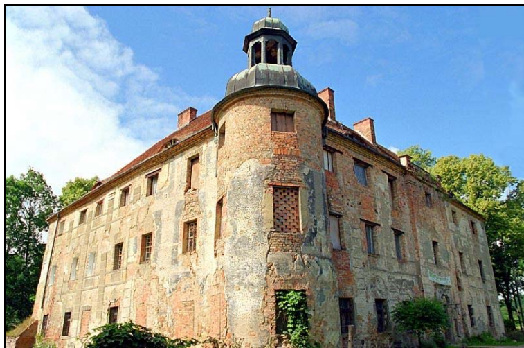
Ryc. 6. Dwór w Broniszowie.

dynek w Broniszowie uzyskał w elewacji frontowej kamienny portal oraz inne barokowe dekoracje. W połowie XIX wieku dwór został rozbudowany. Zamykające mury pozwoliły uzyskać wewnętrzny dziedziniec, a w narożniku południowo-zachodnim dobudowana została neogotycka cylindryczna baszta zwieńczona krenelaczem.