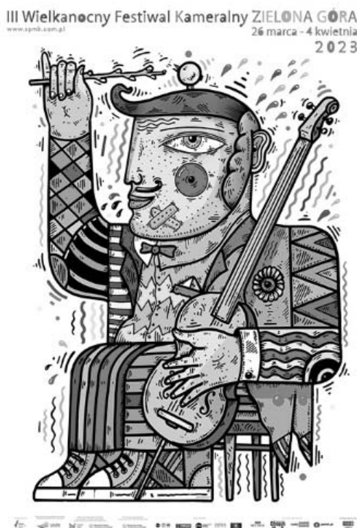
Rysunek 1. Wielkanocny Festiwal Kameralny – plakat.

ich zdania o wykonywanych utworach, stanowi najlepszą przestrzeń dla zbliżenia z publicznością.