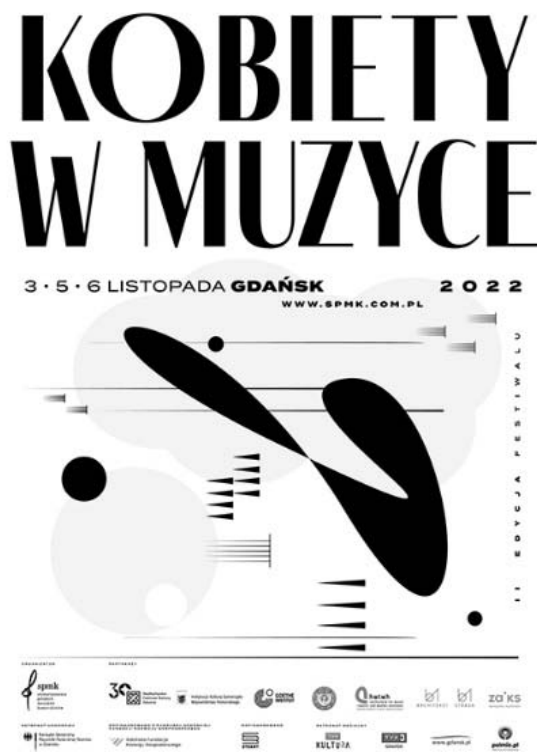
Rysunek 2. Plakat Festiwalu „Kobiety w muzyce”.