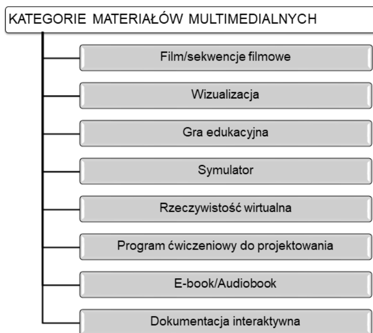
Rysunek 1. Baza materiałów multimedialnych wykorzystywanych w e-zasobach do kształcenia zawodowego.

Działania projektowe były podejmowane w kilku etapach. W pierwszym kroku opracowano dokumenty, w których zdefiniowano wizję przyszłych e-materiałów oraz standardy ich weryfikacji (Wiedza Edukacja Rozwój). Głównym rezultatem działań projektowych była „Koncepcja e-materiałów do kształcenia zawodowego”, opracowana przez Zespół Ekspertów Branżowych – nauczycieli oraz pracodawców reprezentujących wszystkie branże zawodowe. W celu jednoznacznego rozumienia pojęcia e-zasobu do kształcenia zawodowego, przyjęto definicję, iż e-zasób to elektroniczne materiały multimedialne wraz z obudową dydaktyczną wspierające osiągnięcie wybranych efektów oraz celów kształcenia.